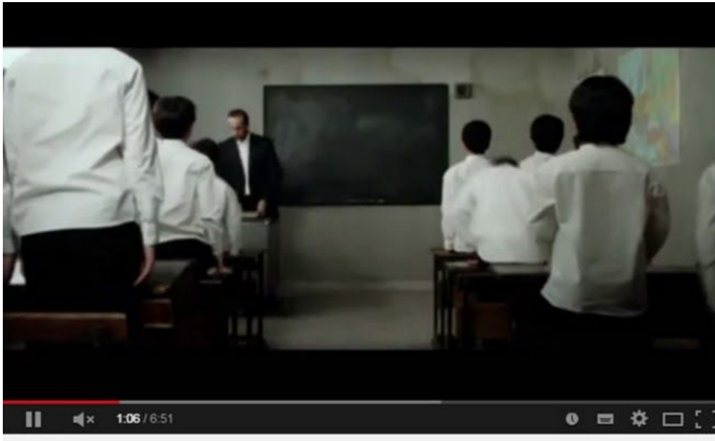
2+2=5 Short movie [Greek subs]