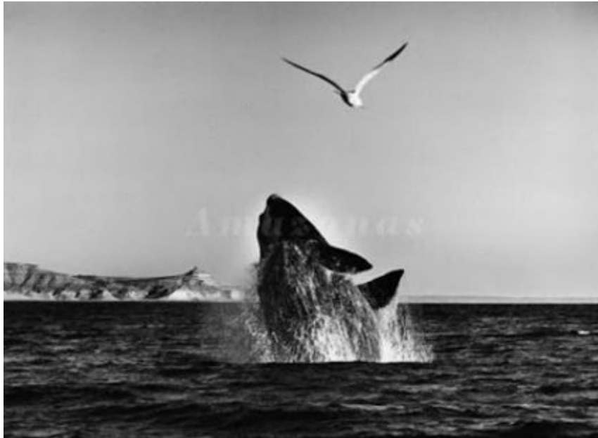
THE WHALES, Patagonia, Argentina. 2004