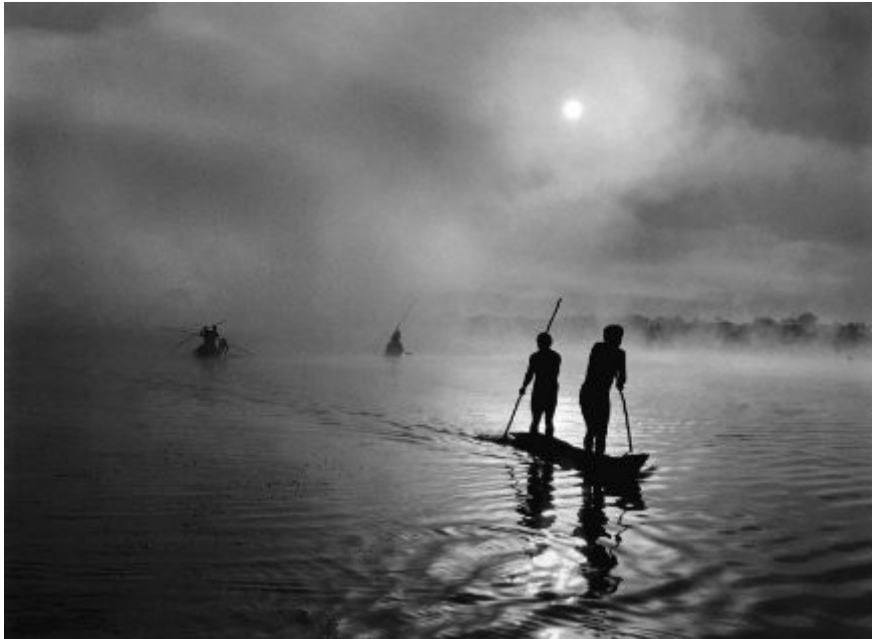
Sebastião Salgado, The State of Amazonas, Brazil. 2009

Από τη διεύθυνση: https://chloenelkin.wordpress.com/tag/sebastiao-salgado/