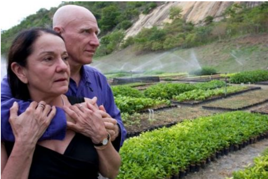
Σεμπασιάο Σαλγκάδο με τη γυναίκα του

Παπανάγνου Βάϊος Ερωτική επιστολή στη Γη