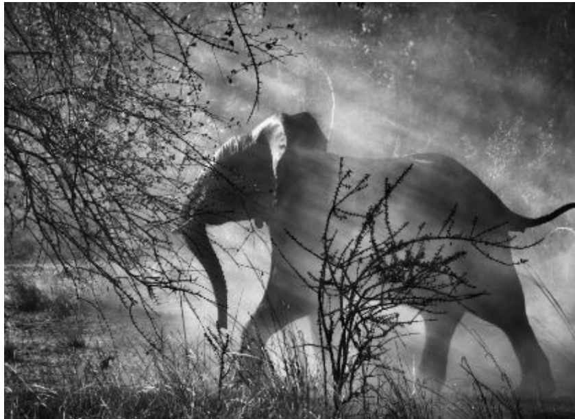
Sebastião Salgado, Kafue National Park. Zambia. 2010. Amazonas images-Contact Press Images.

Από τη διεύθυνση: https://chloenelkin.wordpress.com/tag/sebastiao-salgado/