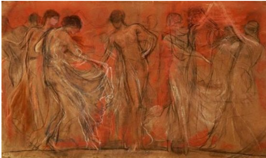
Νικόλαος Γύζης, Ο χορός των Μουσών , 1875, 46 X 78 cm, μολύβι και παστέλ σε χαρτί, Ιδιωτική συλλογή