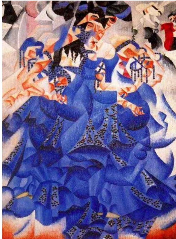
Gino Severini, Blue Dancer (Ballerina blu), 1912, Oil on canvas with sequins, Peggy Guggenheim Collection, Venice.