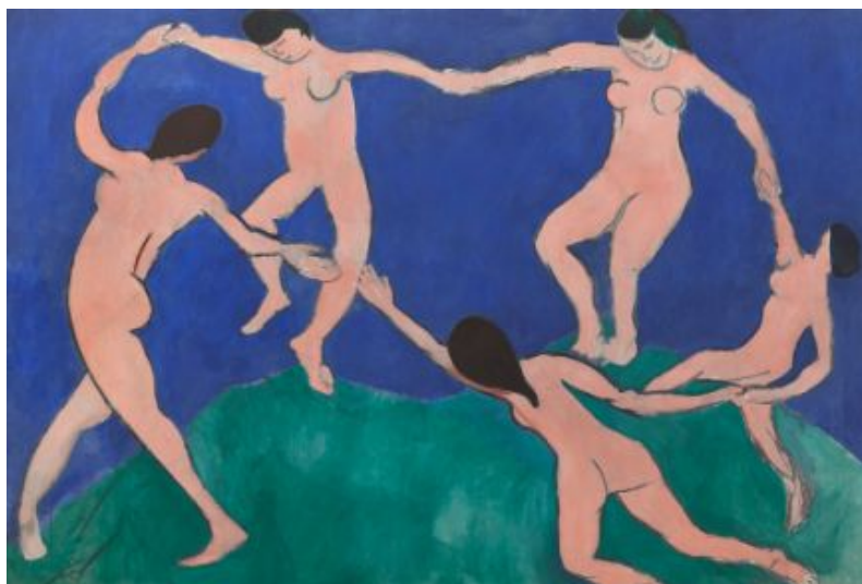
Henri Matisse, Dance (I). Paris. Boulevard des Invalides , early 1909, 259.7 x 390.1 cm, λάδι σε καμβά, MoMA