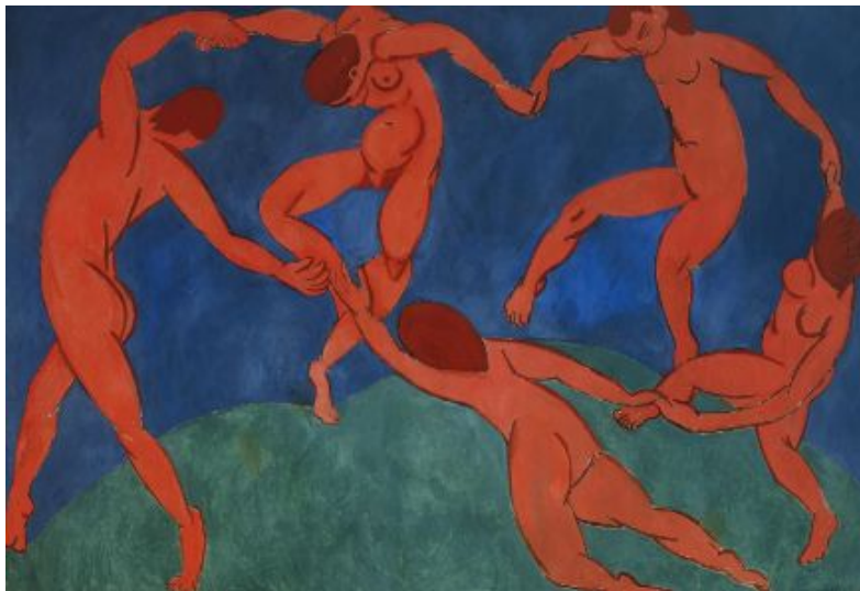
Henri Matisse, Dance , 1909-1910, 2.60X3.91cm, λάδι σε καμβά, Hermitage Museum