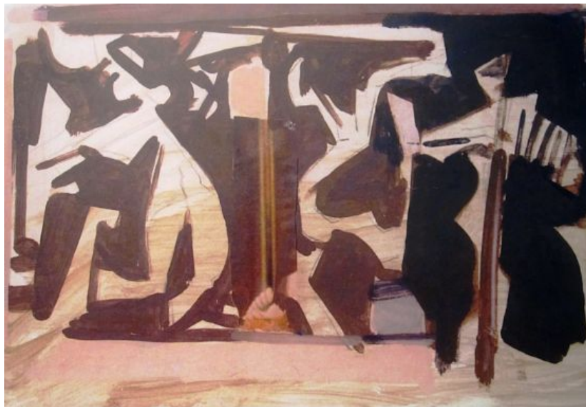
Κώστας Κοντογιάννης, Χορός, 1998, 100 X140