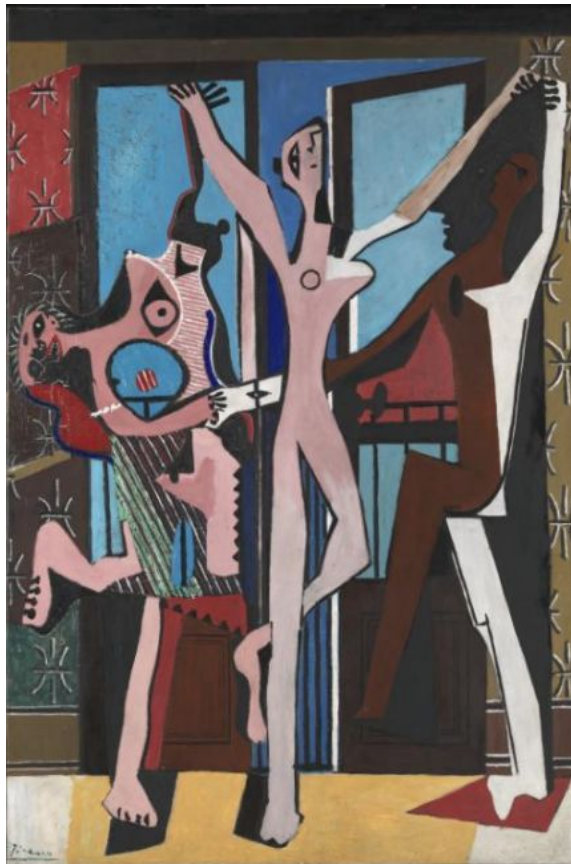
Pablo Picasso, The Three Dancers , 1925, 215.3 cm × 142.2 cm , λάδι σε καμβά, Tate Gallery, London