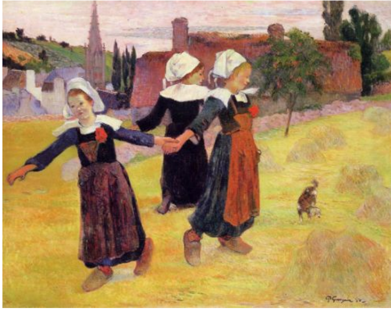
Paul Gauguin , Breton Girls Dancing (La Ronde des petites Bretonnes) , 1888, 106 x 87.6 cm,

λάδι σε καμβά, National Gallery of Art de Washington