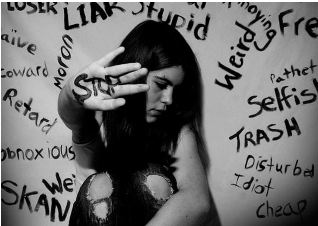
Η φωτογραφία από τη διεύθυνση http://goo.gl/RmO5iG

Κάθε μαθητής επιλέγει ένα είδος κειμένου και αναπτύσσει το θέμα. Το κείμενο μπορεί να αναφέρεται στην ανάγκη για επικοινωνία, στην έλλειψη ή στην πληρότητα της επικοινωνίας. Μπορεί να είναι θεατρικός διάλογος, ποίημα, διήγημα, επιστολή, δοκίμιο, άρθρο σε μαθητικό περιοδικό ή να είναι ένα πολυτροπικό κείμενο, πχ. αφίσα, βιντεάκι με εικόνα, λόγο και μουσική.