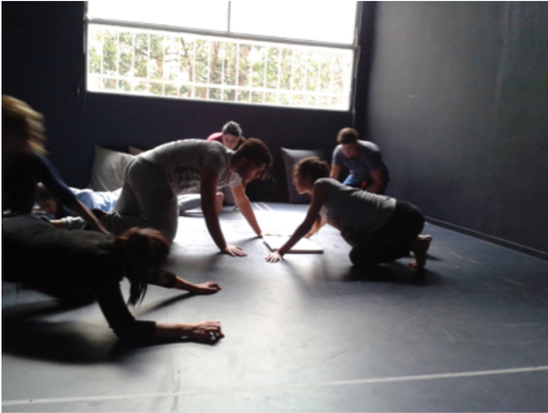
Ομάδα “Vis motrix”, Θεσσαλονίκη 2014 -2015