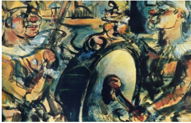
George Rouault, Η παρέλαση , 1948