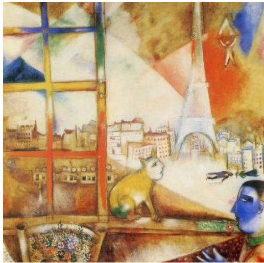
Marc Chagall Το Παρίσι μέσα από το παράθυρό μου (1915)