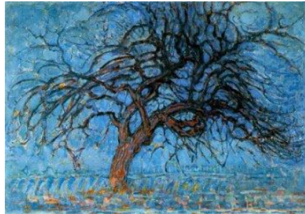
Red tree , Πιτ Μοντριάν, 1909

«Η ποίηση είναι απαραίτητη — θα ήθελα μόνο να ξέρω γιατί.» Με αυτή τη χαριτωμένη και παράδοξη φράση διαπίστωσε ο παλαιός Γάλλος πρωτοποριακός ποιητής Κοκτώ την αναγκαιότητα της τέχνης — και το αμφίβολο της θέσης της στον όψιμο αστικό κόσμο.