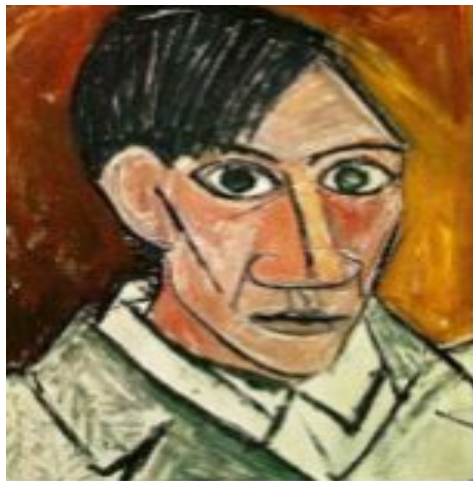
Αυτοπροσωπογραφία, Π. Πικάσο