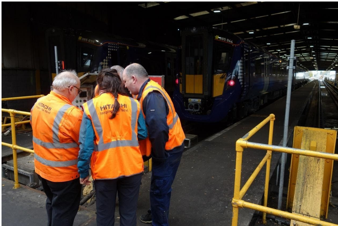
Συνεργασία, μετανάστες και ντόπιοι εργαζόμενοι