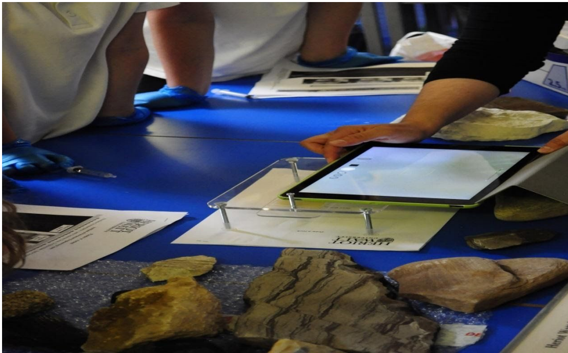
Πειράματα από Ελληνίδα πανεπιστημιακό σε ντόπιους και μετανάστες μαθητές