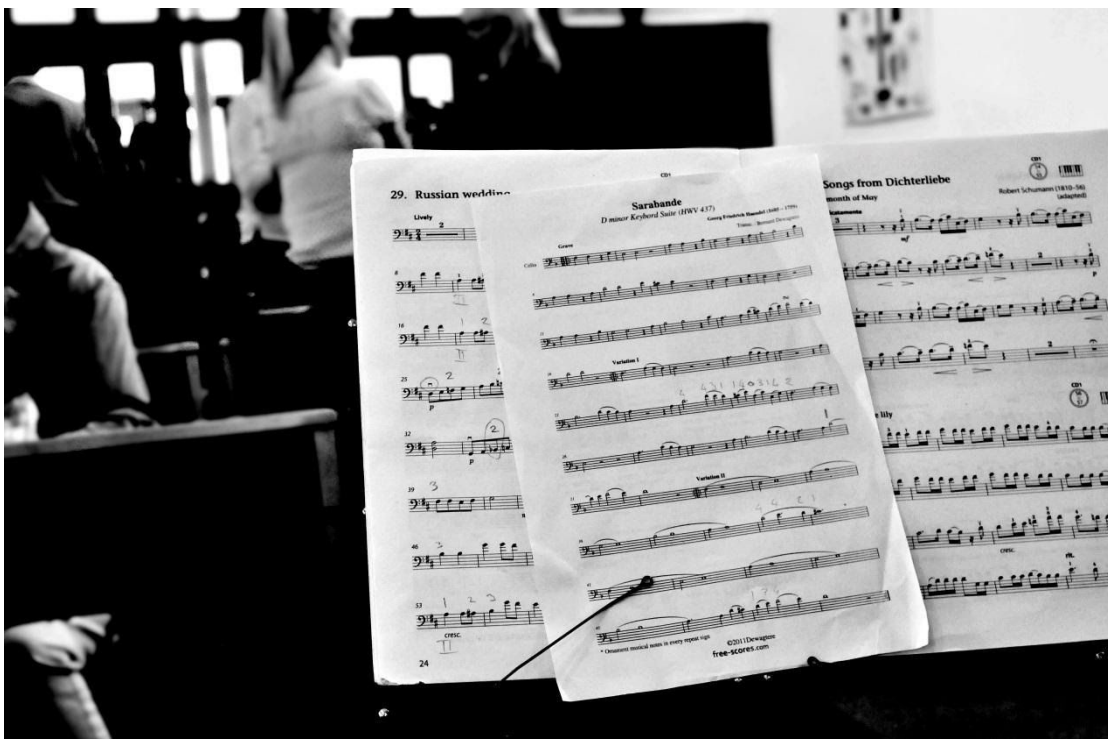
Μαθήματα μουσικής σε μετανάστες και ντόπιους μαθητές από Ελληνίδα καθηγήτρια.