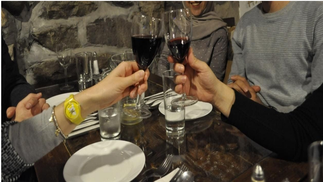
Παρέα με άλλες εθνότητες, φιλία