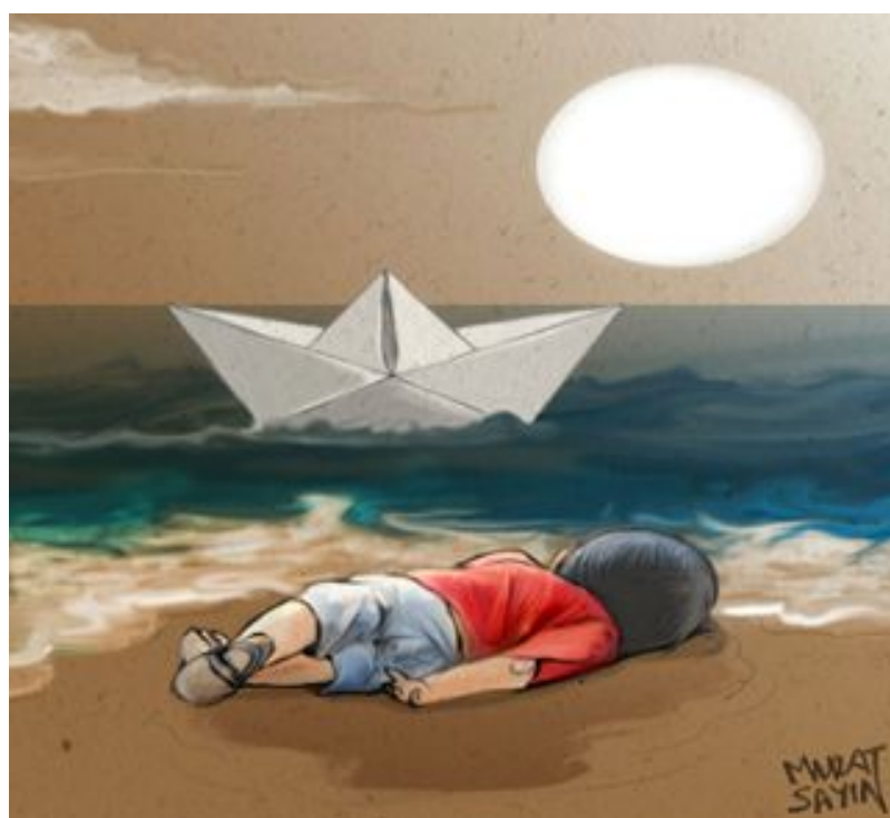
Khaled al Bahi