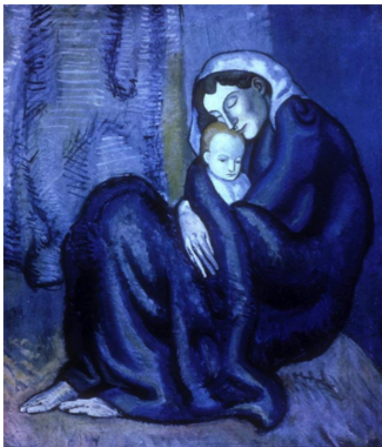
Pablo Picasso, "Mother and child"