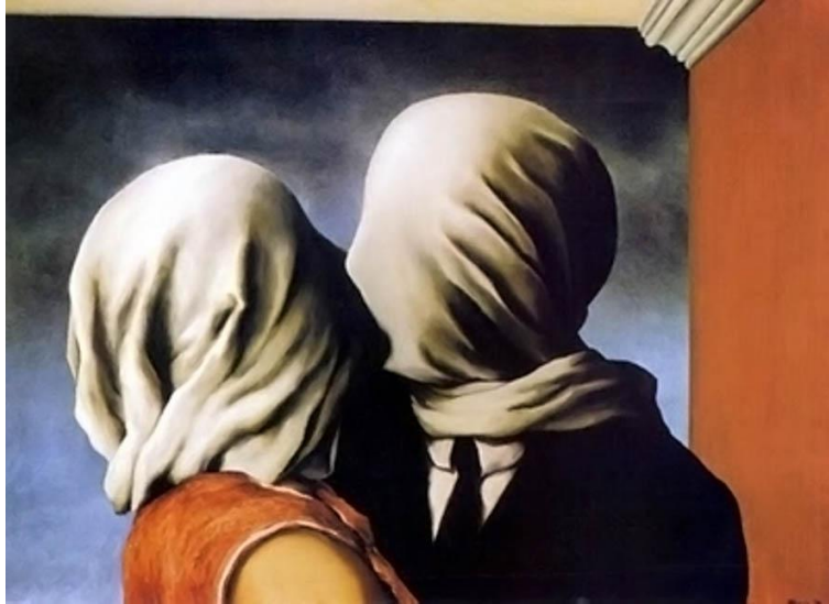
René Magritte «The Lovers» 1928