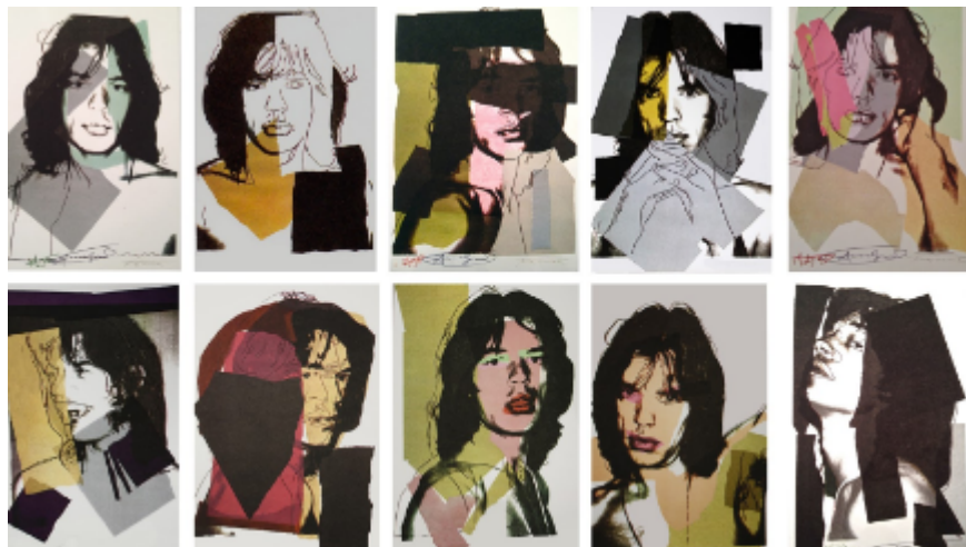
Warhol, Mick Jagger , 1975, 111X 73 Silkscreen prints

Φωτογραφίες: Πηγή - Warhol, Klaus Honnef, Taschen Warhol Andy