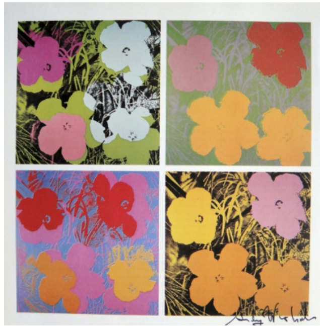
Warhol, Flowers , 1970