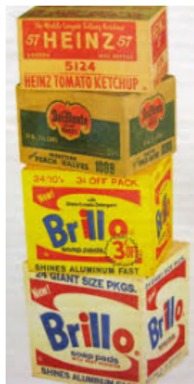
Warhol, Brillo Del Monte and Heinz Cartons , 1964