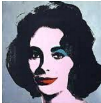
Warhol, Liz , 1965, 101.6 X 101.6, Silkscreen on canvas