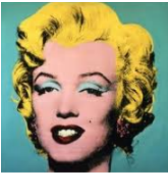
Warhol, Marilyn , 1964, 101.6 X 101.6, Silkscreen on canvas