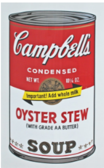
Warhol, Campbell's soup , 1968