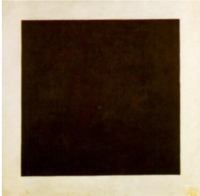
Kazimir Malevich, Μαύρο σουπρεματιστικό τετράγωνο ή Μαύρο ορθογώνιο ή τετράγωνο , 1915, ελαιογραφία, 24x17 cm

Δείτε τώρα: α) το έργο Μαύρο τετράγωνο του Ρώσου ζωγράφου Καζιμίρ Μάλεβιτς (Kazimir Malevich) 1 , το οποίο εξέφραζε το τέλος της παλιάς τέχνης και ταυτόχρονα την αρχή της καινούριας.