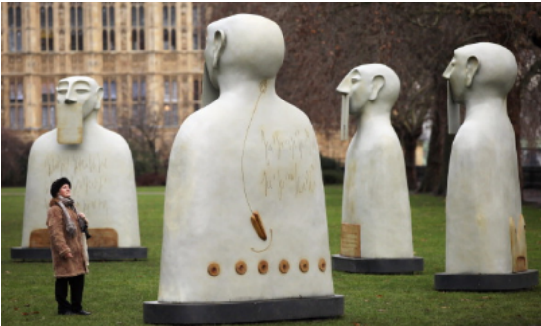
Rivelino Moreno Fence, Nuestros silencios

Ανατρέξτε στο διαδίκτυο, για να δείτε φωτογραφίες του έργου Οι Σιωπές μας ( Nuestros silencios ) του Μεξικανού γλύπτη Ριβελίνο Μορένο Φένς (Rivelino Moreno Fence). Πρόκειται για ένα εμβληματικό έργο μνημειακής γλυπτικής, που αποτελείται από δέκα τρισδιάστατα ανθρωπόμορφα μπρούντζινα γλυπτά μεγάλων διαστάσεων (3,5 x 2,30 x 1,10 μ.) και πολύ βαριά, το καθένα ζυγίζει έναν τόνο. Απηχεί την παραδοσιακή μνημειακή γλυπτική του Μεξικού και, σύμφωνα με τον δημιουργό, είναι ένα έργο με δημόσιο χαρακτήρα, που καλεί τον θεατή να αναστοχαστεί πάνω στη σιωπή και στην ελευθερία της ατομικής και της συλλογικής έκφρασης. Το έργο έχει εκτεθεί σε δημόσιους χώρους σε πολλές ευρωπαϊκές πόλεις (Λισαβόνα, Μαδρίτη, Βρυξέλλες, Πόσναμ, Ρώμη, Λονδίνο, Αγία Πετρούπολη, Μόσχα) και τελικά, το 2011, στήθηκε στην πόλη του Μεξικού, στην κεντρική πλατεία Zocalo.