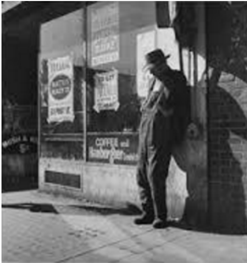
Α. Αμερική 1929

Παρατηρήστε προσεκτικά τις φωτογραφίες Α και Β. Η φωτογραφία Α είναι τραβηγμένη στην Αμερική την εποχή της μεγάλης οικονομικής κρίσης του 1929, ενώ η Β είναι τραβηγμένη στην Ελλάδα της οικονομικής κρίσης του 2014.