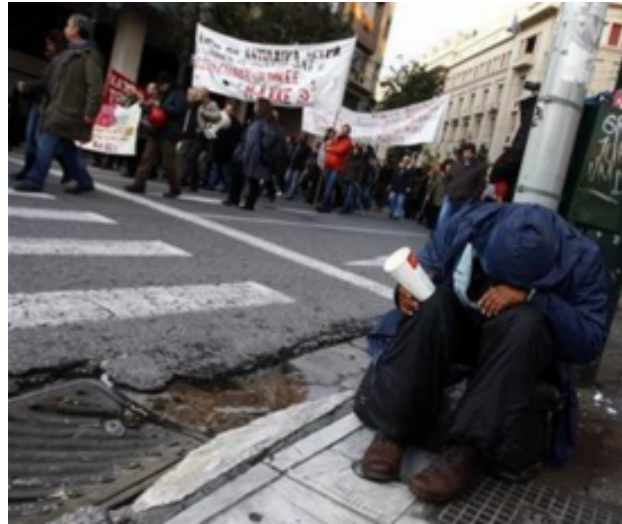
Β. Ελλάδα 2014