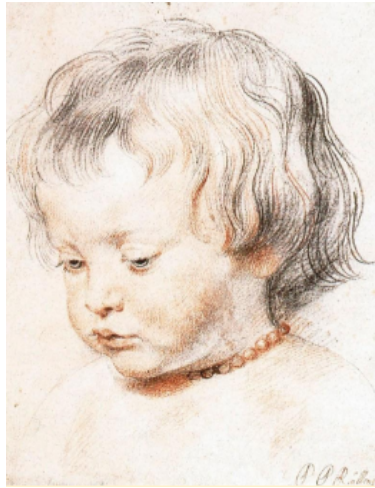
(Εικόνα 1) Ρούμπενς, Προσωπογραφία του γιου του Νικόλα, περ. 1620 Μαύρη κιμωλία και σανγκίνα πάνω σε χαρτί, 25,2 x 20,3 εκ., Αλμπερτίνα, Βιέννη

Ο Άλμπρεχτ Ντύρερ, ο μεγάλος Γερμανός ζωγράφος, σχεδίασε ασφαλώς τη μητέρα του (Εικόνα 2) με όση αφοσίωση κι αγάπη ένιωθε και ο Ρούμπενς για το παχουλό παιδί του. Η ακριβής σπουδή μιας γριάς που την έφθειραν οι έγνοιες μπορεί να δυσαρεστήσει τον θεατή, που θα στρέψει αλλού το πρόσωπό του. Αν όμως ξεπεράσει την αρχική αποστροφή του, θα αμειφθεί πλουσιοπάροχα, γιατί, στην τρομερή του ειλικρίνεια, το σχέδιο του Ντύρερ είναι μεγάλο έργο. Πράγματι, θ' ανακαλύψουμε σύντομα πως η ομορφιά ενός πίνακα είναι άσχετη με την ομορφιά του θέματος του.