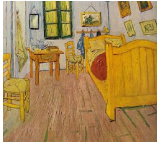
Βικέντιος Βαν Γκογκ (Vincent Willem van Gogh),

Το δωμάτιο του καλλιτέχνη στην Αρλ, 1889, 7,5 X 74 cm.,