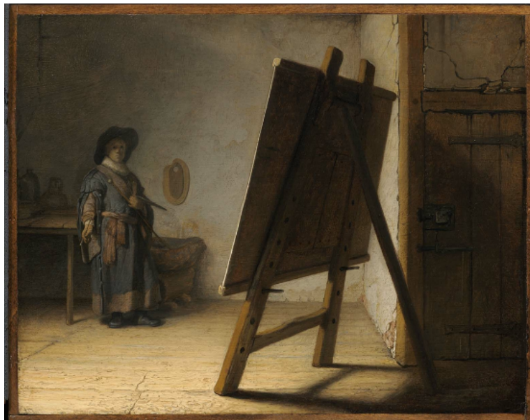
Ρέμπραντ (Rembrandt Harmensz. van Rijn), Ο καλλιτέχνης στο ατελιέ του ( Artist in his Studio ), περίπου το 1628