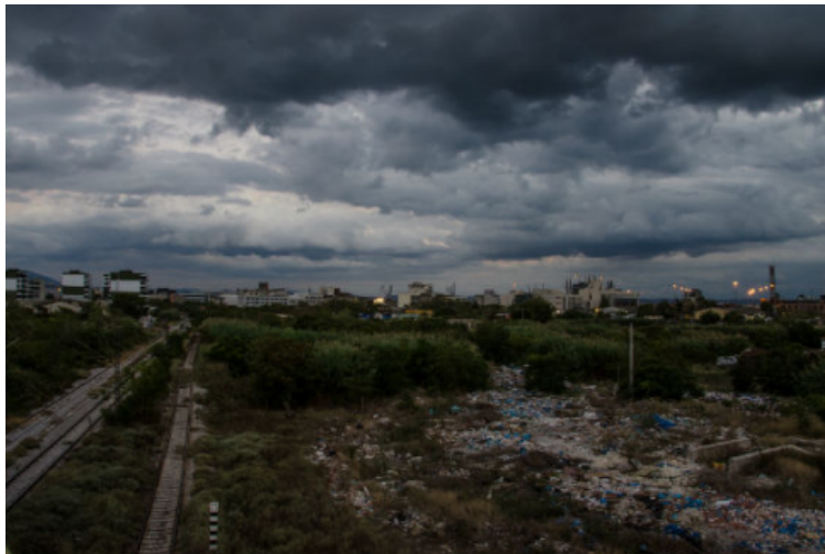
Η ομορφιά της ασχήμιας

Το κάδρο αποτυπώθηκε πάνω απ' την αερογέφυρα - της δυτικής εισόδου της Θεσσαλονίκης - με θέα προς το λιμάνι