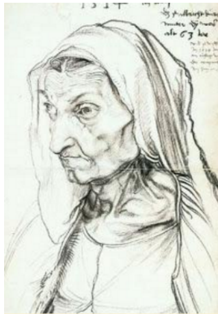
(Εικόνα 2) Άλμπρεχτ Ντύρερ, Προσωπογραφία της μητέρας του, 1514 Μαύρη κιμωλία πάνω σε χαρτί, 42,1 X 30,3 εκ. Μουσείο Χαλκογραφιών, Κρατικά Μουσεία, Βερολίνο

Ο Άλμπρεχτ Ντύρερ, ο μεγάλος Γερμανός ζωγράφος, σχεδίασε ασφαλώς τη μητέρα του (Εικόνα 2) με όση αφοσίωση κι αγάπη ένιωθε και ο Ρούμπενς για το παχουλό παιδί του. Η ακριβής σπουδή μιας γριάς που την έφθειραν οι έγνοιες μπορεί να δυσαρεστήσει τον θεατή, που θα στρέψει αλλού το πρόσωπό του. Αν όμως ξεπεράσει την αρχική αποστροφή του, θα αμειφθεί πλουσιοπάροχα, γιατί, στην τρομερή του ειλικρίνεια, το σχέδιο του Ντύρερ είναι μεγάλο έργο. Πράγματι, θ' ανακαλύψουμε σύντομα πως η ομορφιά ενός πίνακα είναι άσχετη με την ομορφιά του θέματος του.