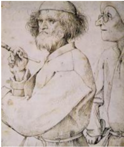
Πίτερ Μπρέγκελ ο Πρεσβύτερος (Pieter Bruegel the Elder),

Ο Ζωγράφος και ο αγοραστής, περ. 1565, 25 X 21.6 74 cm.,